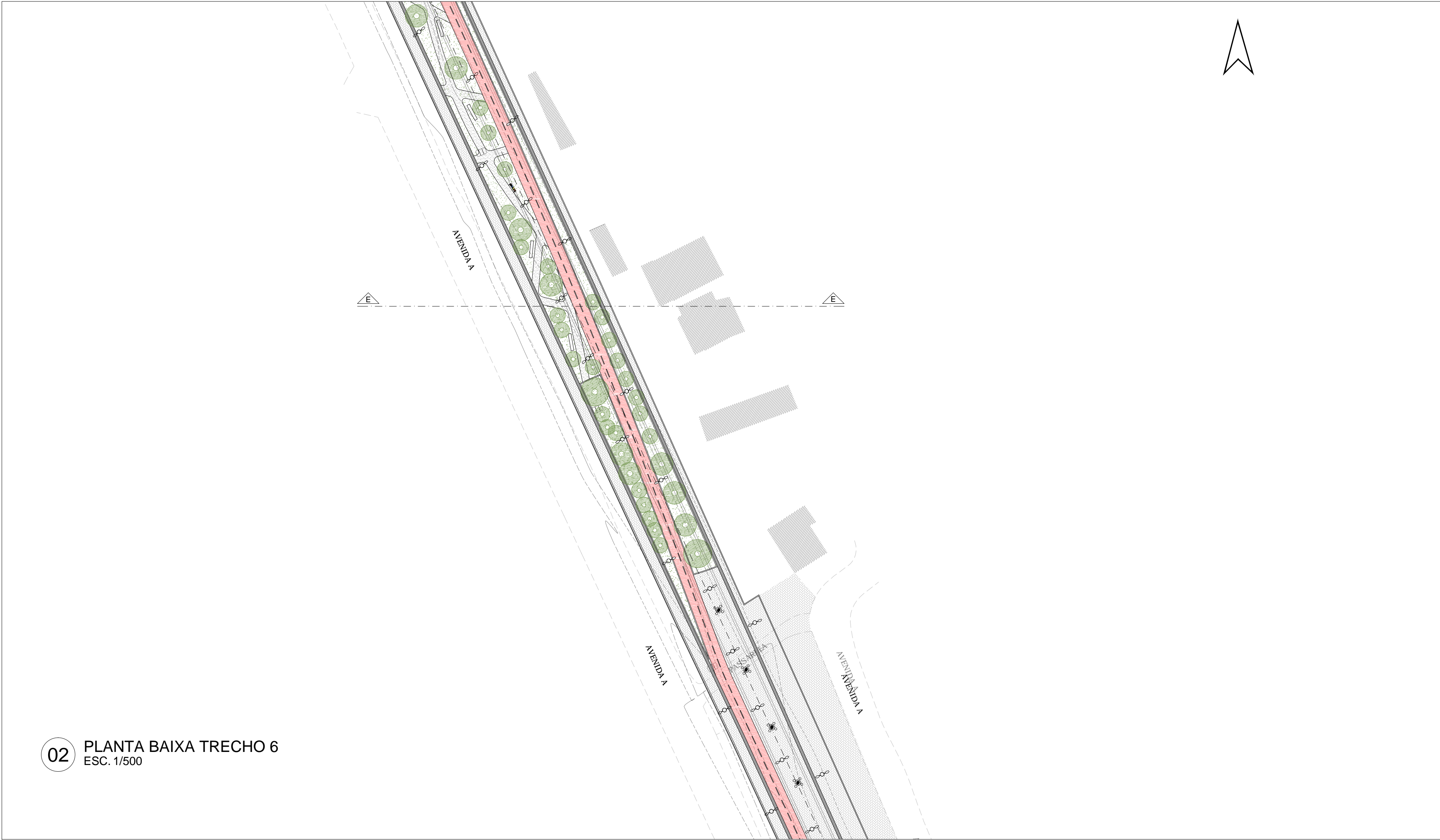
02 PLANTA BAIXA TRECHO 6 ESC. 1/500