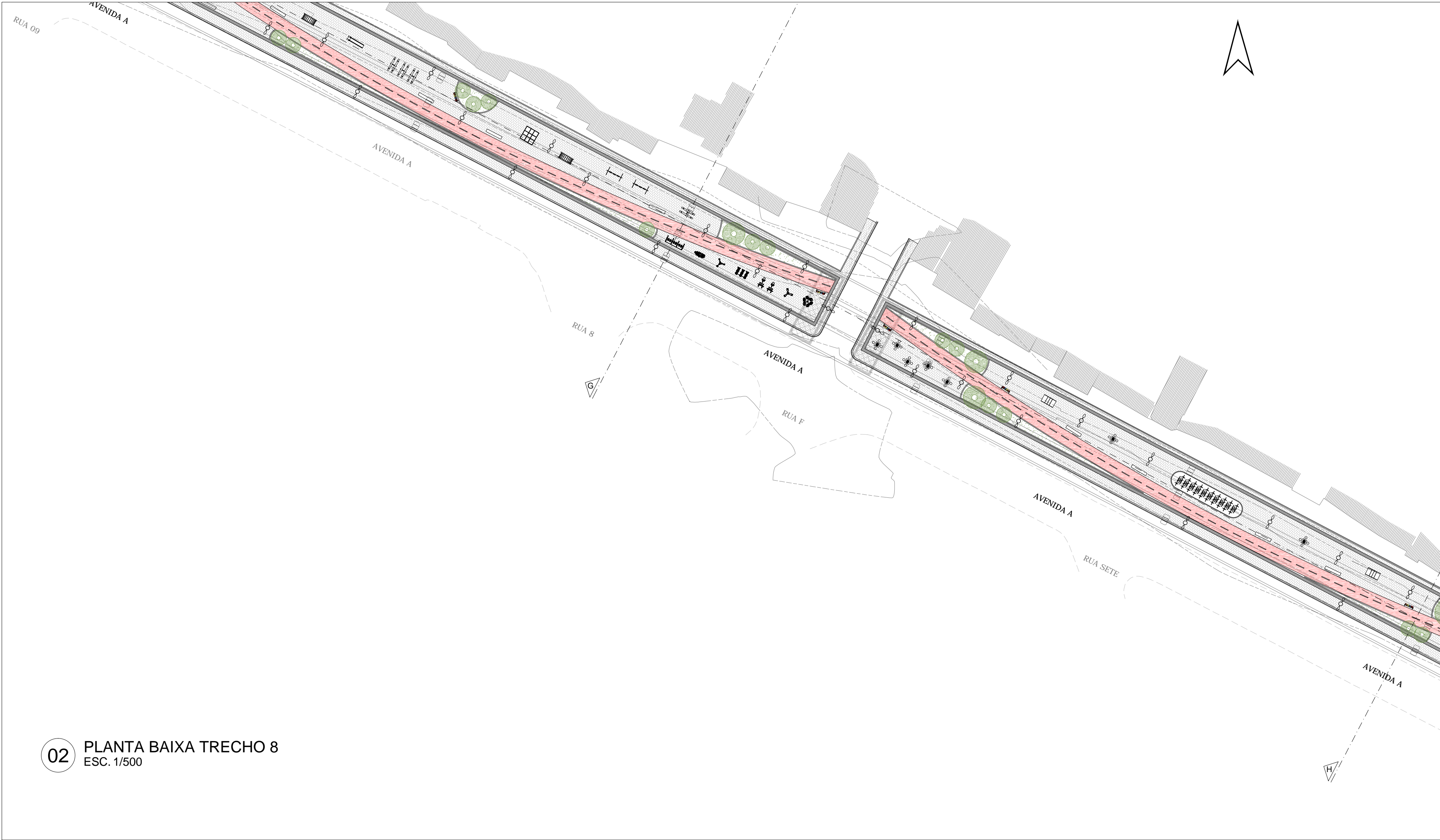
02 PLANTA BAIXA TRECHO 8 ESC. 1/500