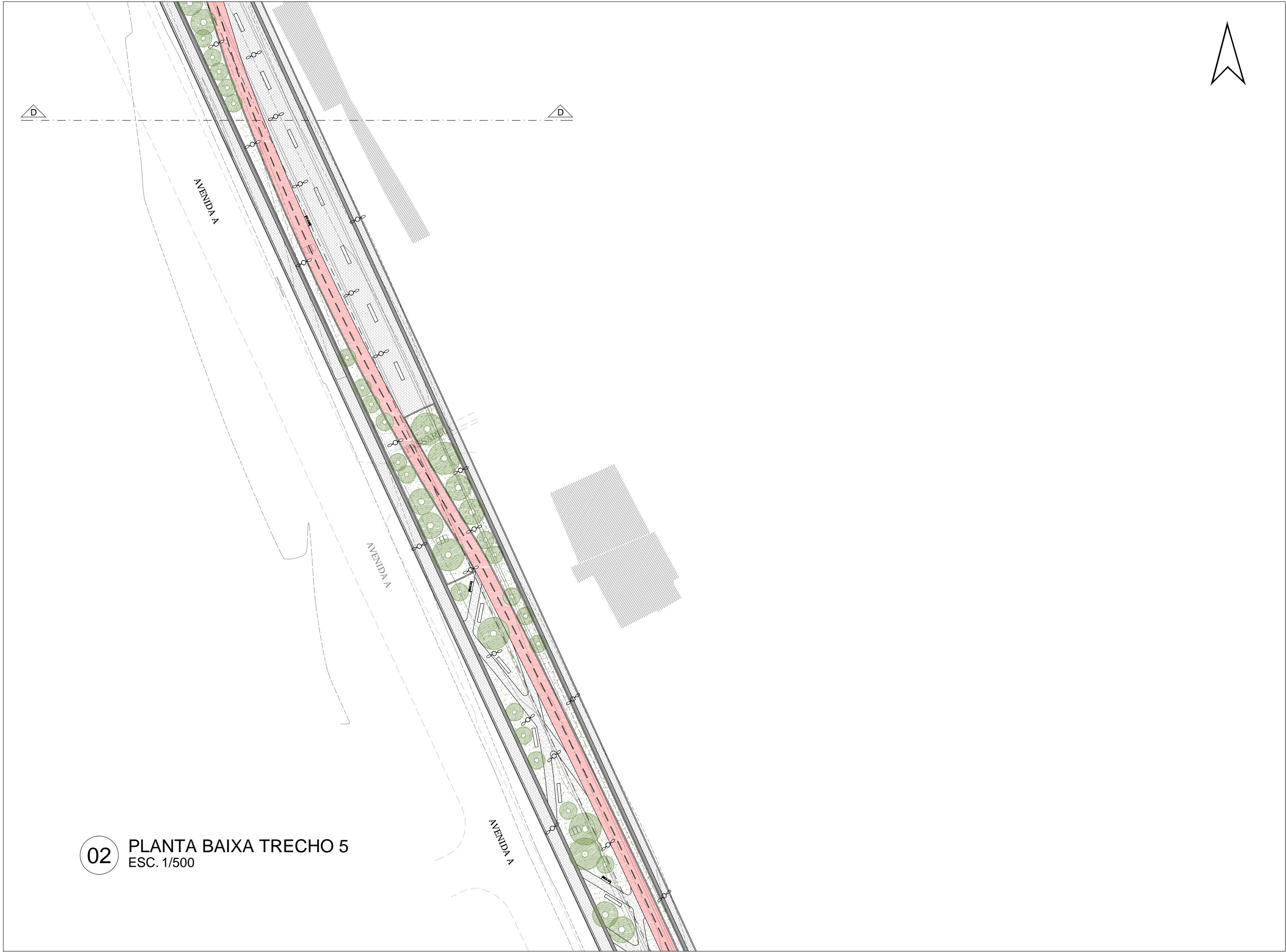
02 PLANTA BAIXA TRECHO 5 ESC. 1/500